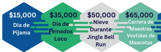
Premios Para Toda la Escuela

Los estudiantes y las clases recibirán premios según los fondos que recauden. También hay premios para toda la escuela.